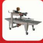
SEMI-AUTOMATIC CARTON SEALER