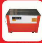
SEMI-AUTOMATIC STRAPPING MACHINE