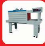
LDPE SHRINK TUNNEL