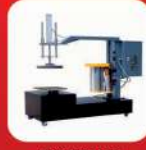
BOX STRETCH WRAPPING MACHINE