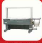
AUTOMATIC STRAPPING MACHINE