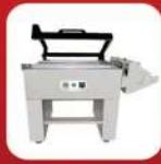
MANUAL L SEALER